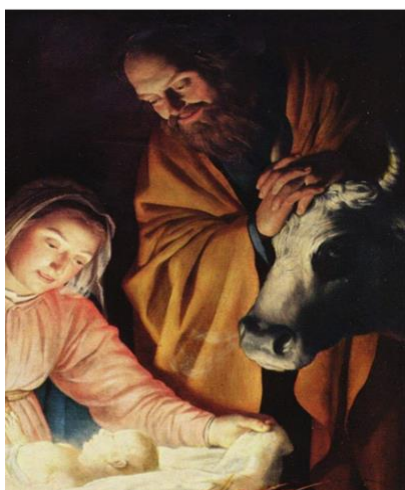
Gerhard van Honthorst „Anbetung der Hirten“ (1622) Ausschnitt

Im Namen der SMV heißen wir alle Eltern und Schüler*innen sehr herzlich willkommen zum vorweihnachtlichen Basar am letzten Schultag vor Weihnachten, also am Freitag, dem 20.12.2019. In der dritten und vierten Stunde (9.30 bis 11.00 Uhr) wird es ein buntes vorweihnachtliches Treiben in der Schule geben: Die sechsten Klassen und die Kursstufen 1 und 2 sorgen für das leibliche Wohl. Alle anderen Klassen bieten eigene kleine Programmpunkte an unter dem Motto „ Weihnachten – nachhaltig und in verschiedenen Kulturen “. Alle Gäste mögen bitte eigene Becher und Teller mitbringen. Andernfalls ist Geschirr gegen eine kleine Gebühr auszuleihen.